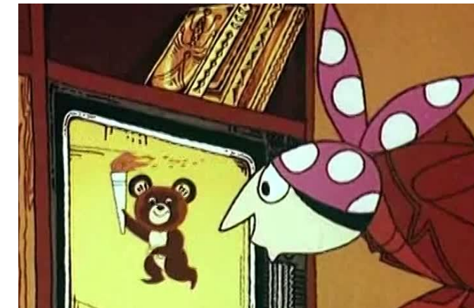
А Баба-Яга против! (Мультфильм)

Федеральная антимонопольная служба (ФАС) России настаивает на снижении верхней границы тарифного коридора РЖД до 5% в 2018 г. и до 0% в 2019 г. Менять эту позицию служба не намерена. Об этом сообщил журналистам глава службы Игорь Артемьев