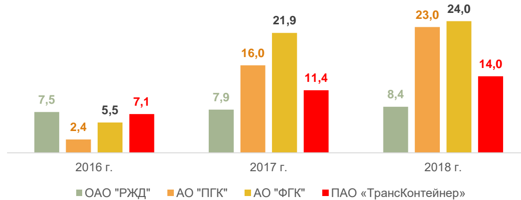
Рентабельность продаж, %

Постановление Правительства РФ от 18.05.2001 № 384 "О Программе структурной реформы на железнодорожном транспорте"