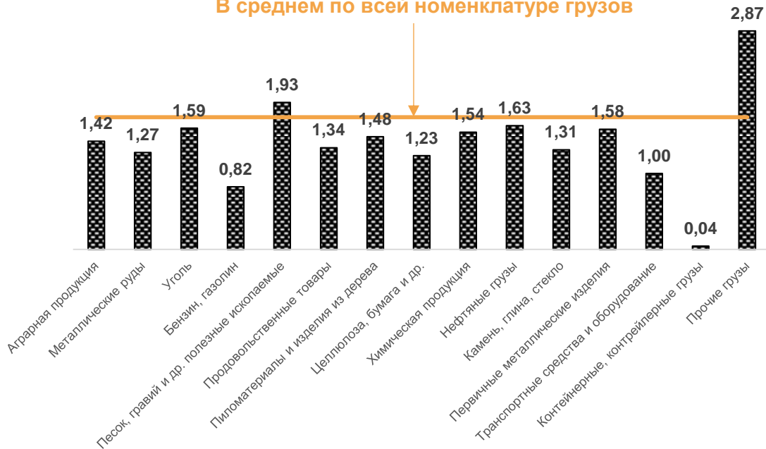
Динамика доходной ставки Canadian National Railway Company (Канада), 2018 г. в разгах к 2011 г.